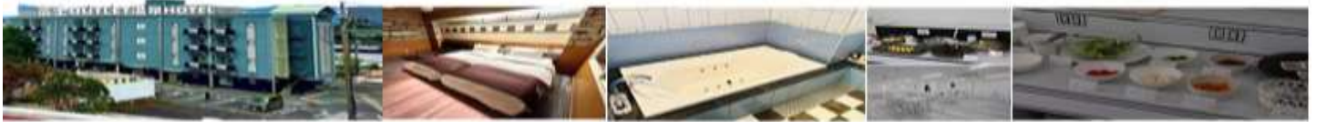
FUJI OUTLET HOT SPRING HOTEL OR SIMILAR

*** ในกรณีที่โรงแรมไม่เพียงพออันเนื่องมาจากเหตุสุดวิสัย จะปรับไปนอนโรงแรมเทียบเท่ากัน แต่อาจจะไม่มีการใช้น้ำแร่อบในห้องส่วนตัว แต่เป็นโรงแรมที่มีออนเซนแทน