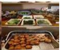
Hotel Route-Inn Court Azumino Toyoshina Ekiminami or Similar

วันที่ 3 คามิโคจิ - ปราสาทมัตสึโมโตะ - หมู่บ้านน้ำใส โอชิโนะฮัทได