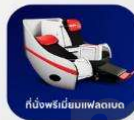
ที่นั่งพรีเมียมพลาติน