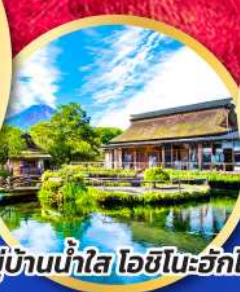
หมู่บ้านน้ำใส โอชิโนะอ๊กโก