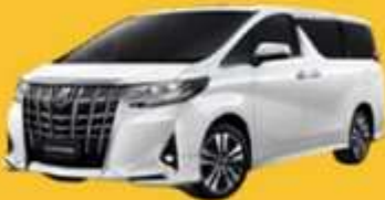
Alphard (2-4 ท่าน)