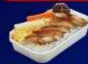
ข้าวหน้าไก่ย่างเกาหลี