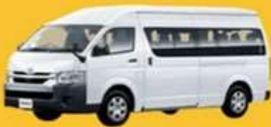
VAN (2-8 ท่าน)