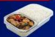
ข้าวกะเพราไก่