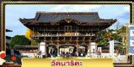
วัดนาริตะ