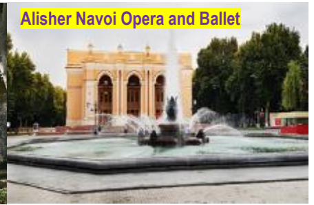
Alisher Navoi Opera and Ballet

นำท่านผ่านชม พระราชวังโรมานอฟ (Former Residence of Prince Romanov/The Palace of Grand Duke Nicholas Constantinovich) ที่ประทับของเจ้าชายนิโคลาส คอนสแตนติโนวิช หลานชายของซาร์นิโคลัสที่ 1 แห่งราชวงศ์โรมานอฟ ที่ได้เสด็จหนีออกมาอยู่ที่กรุงทาชเคนต์ในปี ค.ศ. 1877 โดยวังที่พักแห่งนี้ถูกสร้างขึ้นราว ค.ศ. 1891 และอยู่ในวังแห่งนี้จนเสียชีวิตในปีค.ศ. 1918 งดงามด้วยสถาปัตยกรรมการออกแบบที่ล้ำยุคแห่งกาลเวลาของเบนีตและเกย์ทเซลแมน แล้วพาท่านชม โรงละครออลิเชอร์นาวอย (Alisher Navoi Opera and Ballet Theatre) *ชมภายนอก* ถูกสร้างขึ้นในปี ค.ศ. 1947 โดยสถาปนิกชาวรัสเซีย อเล็ก เซย์ชูเซฟ (Aleksey Shchusev) ซึ่งเคยเป็นผู้ออกแบบที่ฝั่งศพของเลนินมาก่อน สถานที่แห่งนี้มีชื่อเสียงและเป็นความภูมิใจอย่างยิ่งของอุซเบกิสถาน เพื่อระลึกถึงนักปราชญ์ผู้ยิ่งใหญ่ที่มีผลงานทางด้านการประพันธ์ศิลปะและดนตรี และที่สำคัญยังมีบทบาททางด้านการเมืองอีกด้วย เที่ยง บริการอาหารกลางวัน ณ ห้องอาหาร