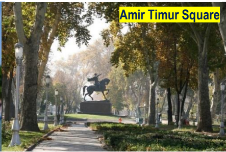
Amir Timur Square