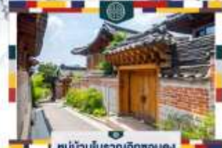
หมู่บ้านโบราณฮิกซอนคย