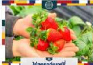
ไร่สตรอว์เบอร์รี่