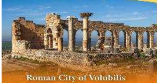
Roman City of Volubilis

เปิดประสบการณ์นอนนับดาวสุดฟิน กลางทะเลทรายซาฮารา "Luxury Camp"