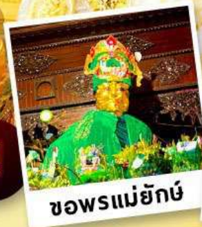
ซอพรแม่ยักย์