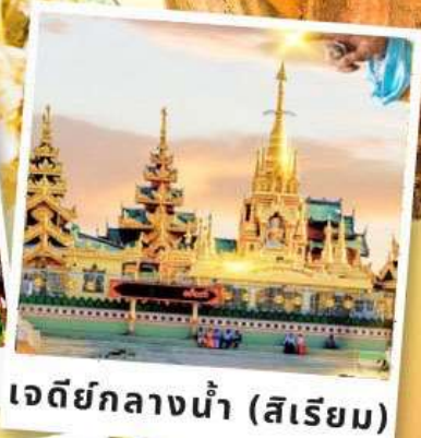
เจดีย์กลางน้ำ (สิเรียม)