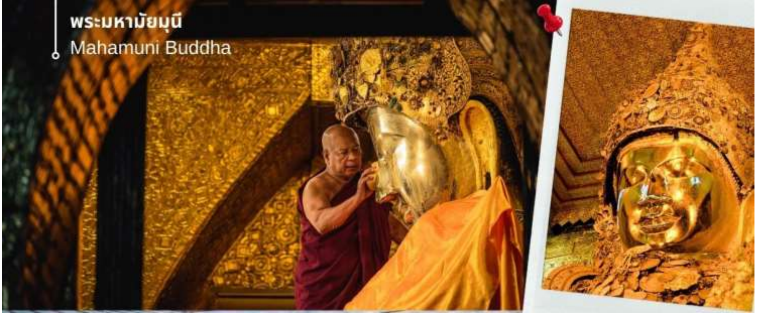
พระมหามัญนี่ Mahamuni Buddha

📌 บริการอาหารเช้า ณ ห้องอาหารของโรงแรม (8) นำท่านเดินทางสู่ เมืองสกายน์ หรือชะไก้ (Sagaing) ตั้งอยู่บนฝั่งขวาของแม่น้ำอิรวดี ตรงข้ามกับเมืองอังวะ เมืองชะไก้มีวัดทางพุทธศาสนาที่สำคัญหลายแห่ง เมืองสร้างขึ้นตั้งแต่คริสต์ศตวรรษที่ 14 เพื่อเป็นเมืองหลวงของอาณาจักรชะไก้ ซึ่งเป็นหนึ่ง