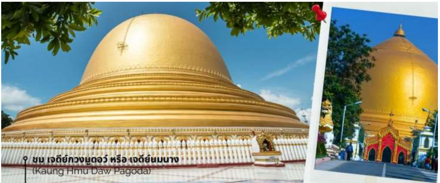
ชม เจดีย์กวงมุดอว์ หรือ เจดีย์นมนาง (Kaung Hmu Daw Pagoda)

นำท่านชม เจดีย์กวงมุดอว์ หรือ เจดีย์นมนาง (Kaung Hmu Daw Pagoda) เป็นเจดีย์พุทธขนาดใหญ่ ตั้งอยู่เขตชานเมืองทางตะวันตกเฉียงเหนือของชะไก้ โดยจำลองตามสวัณณมาลีมหาเจดีย์ ในประเทศศรีลังกา ฐานชั้นล่างสุดของเจดีย์ประดับด้วยนระและเทวดา 120 องค์ ล้อมรอบด้วยคอคหิน 802 ต้น ซึ่งแกะสลักพร้อมจารึกพุทธประวัติสามภาษาได้แก่ พม่า, มอญ และไทใหญ่ เป็นตัวแทนของสามภูมิภาคหลักสมัยอาณาจักรตองอูยุคฟื้นฟู โดมของเจดีย์ได้รับการทาสีขาวอย่างต่อเนื่อง เพื่อแสดงถึง