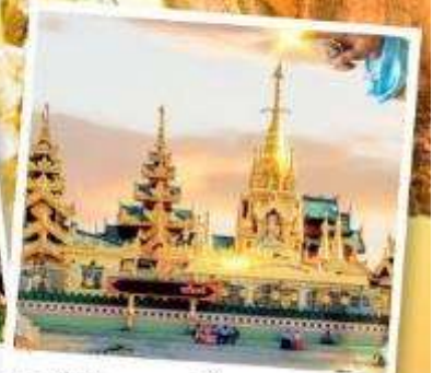
เจดีย์กลางน้ำ (สิริเยม)