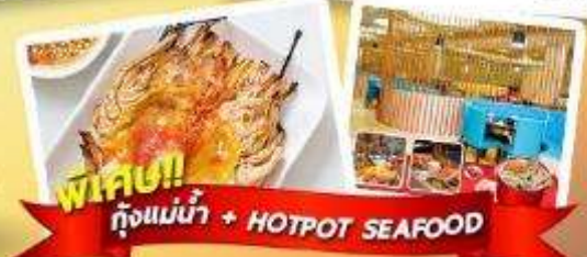
พิเศษ!! กึ่งแม่น้ำ + HOTPOT SEAFOOD