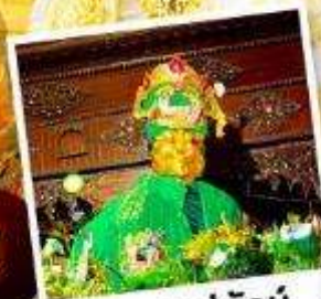
ขอพรแม่ยักย์