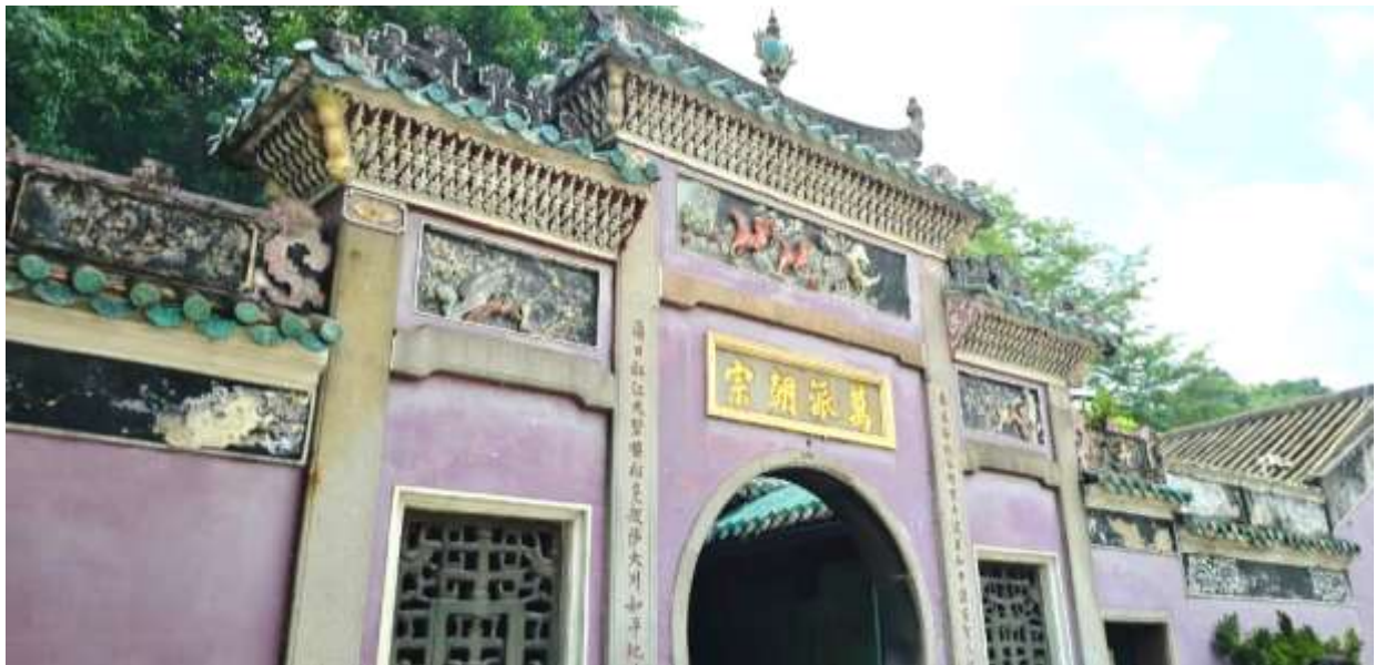
วัฒนธรรมตะวันออกและตะวันตกอย่างลงตัว

นำท่านเดินทางสู่ มาเก๊า (ในการเดินทางข้ามด่าน ท่านจะต้องลากกระเป๋าสัมภาระของท่านเองและผ่านพิธีการตรวจคนเข้าเมืองใช้เวลาในการเดินประมาณ 45-60 นาที) ในอดีตมาเก๊าเป็นเพียงแค่หมู่บ้านเกษตรกรรมและประมงเล็กๆ ซึ่งเป็นเมืองที่มีประวัติศาสตร์ยาวนาน โดยมีชาวจีนกวางตุ้งและฟูเจี้ยนเป็นชนชาติดั้งเดิม จนมาถึงช่วงต้นศตวรรษที่ 16 ชาวโปรตุเกสได้เดินเรือเข้ามายังคาบสมุทรแถบนี้เพื่อติดต่อค้าขายกับชาวจีน และมาสร้างอาณานิคมอยู่ในแถบนี้ ที่สำคัญ คือ ชาวโปรตุเกสได้นำพาเอาความเจริญรุ่งเรืองทางด้านสถาปัตยกรรม และศิลปวัฒนธรรมของชาติตะวันตกเข้ามาอย่างมากมาย ทำให้มาเก๊ากลายเป็นเมืองที่มีการผสมผสานระหว่าง