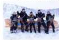
สนุกกับกิจกรรมจับปุยักษ์

00.00 น. ออกเดินทางสู่ เมืองคีร์กเคนเนส โดยสายการบิน...เที่ยวบินที่... 00.00 น. เดินทางถึงสนามบินเมืองคีร์กเคนเนส