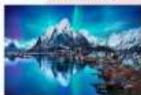
หมู่บ้านโลโฟเทน

00.00 น. ออกเดินทางสู่ เมืองเลกเนส โดยสายการบิน Scandinavian Airlines เที่ยวบินที่ SK 4106 แวะเปลี่ยนเครื่องที่เมือง Bodo เป็นสายการบิน Wide roe WF 810 00.00 น. เดินทางถึงสนามบินเมืองเลกเนส