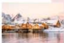
หมู่บ้าน Sakrisoy