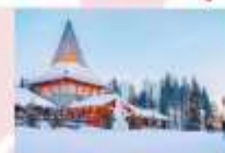
หมู่บ้านซานต้าครอส

15.25 น. ออกเดินทางสู่อิสตันบูล ประเทศตุรกี เที่ยวบินที่ TK 1750 21.10 น. เดินทางถึงสนามบินอิสตันบูล (แวะเปลี่ยนเครื่อง)