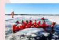
ล่องเรือตัดน้ำแข็ง Ice Breaker