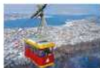
Tromso Cable Car

** ที่พัก CLARION HOTEL THE EDGE OR SIMILAR **