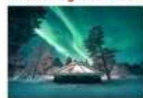
Glass Igloo Hotel

** พักที่ NORTHERN LIGHTS VILLAGE OR SIMILAR **