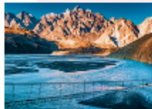
สะพานแขวนอุสโซนิ