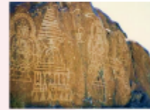
เมืองซีลาส

** พักที่ Shangrila Chilas Hotel หรือเทียบเท่า **