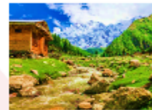
ยอดเขานังกาพาร์บัด

** พักที่ Raikot Sarai Hotel หรือเทียบเท่า **