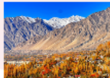
หุบเขาพาสสุ

** พักที่ Sarai Silk Route Hotel หรือเทียบเท่า **