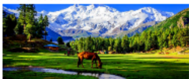
แฟร์มีโควส์