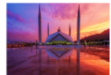
มัสยิดไฟซาล

19.30 น. นำท่านเดินทางสู่สนามบินอิสลามาบัด 23.20 น. ออกเดินทางสู่กรุงเทพ เที่ยวบิน TG350