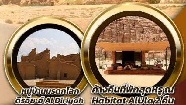
หมู่บ้านมรดกโลก ดิรัยยะฮ์ AlDiriyah คันทันที่พักผ่อนสุดหรู Habit AlUla 2 คืน

บินหรู อยู่สบาย เที่ยวบินดี ซิลด์ ซิลด์ 10 ท่าน คอนเฟิร์มเดินทาง