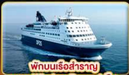
พักผ่อนเรือสำราญ แบบ Window Room 1 คืน