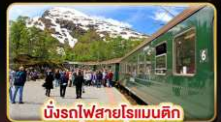
นั่งรถไฟสายโรแมนติก “ฟรอมสปานา”