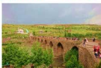
สะพานสิบโค้ง