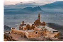
พระราชวังอิซฮาก พาชาร์