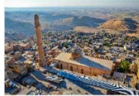
เมืองมาร์ดิน