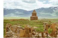
เมืองเอนิชม

15.25-17.50 น. เห็นฟ้ากลับสู่อิสตันบูล โดยสายการบิน TURKISH AIRLINES เที่ยวบินที่ TK 2717 (บินภายในประเทศ)