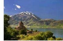
เมืองวาน