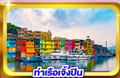
ท่าเรือเจิ้งปิน