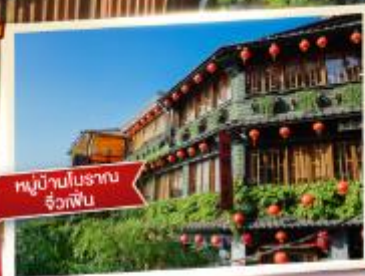
หมู่บ้านโบราณ จื่อคังปิน