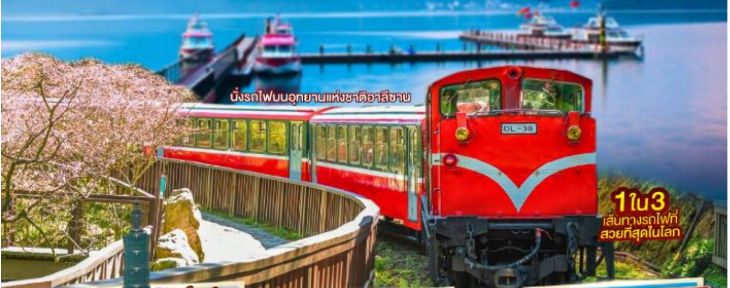
นั่งรถไฟบนอุทยานแห่งชาติอาลีซาน

ประกันการเดินทางอุบัติเหตุ คุ้มครองสูงสุด 3,000,000 บาท/ผู้โดยสาร/เที่ยวบิน