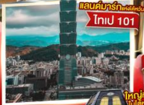
แลนด์มาร์กแห่งไต้หวัน ไทเป 101