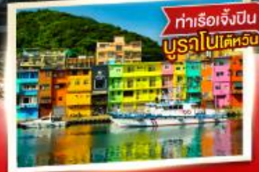
ทำเรือเจ็ปปิน บูราโนไปไต้หวัน