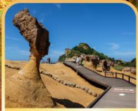
อุทยานหินเหย่หลิว