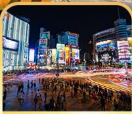
ย่านซีเหมินติง