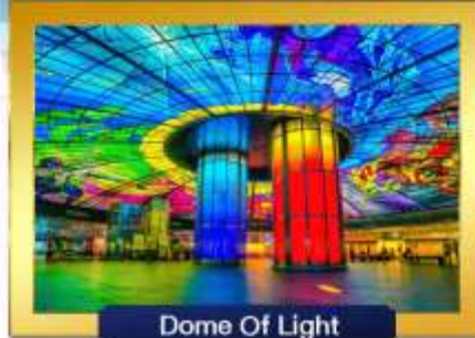
Dome Of Light