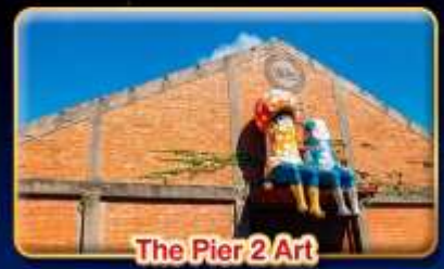
The Pier 2 Art