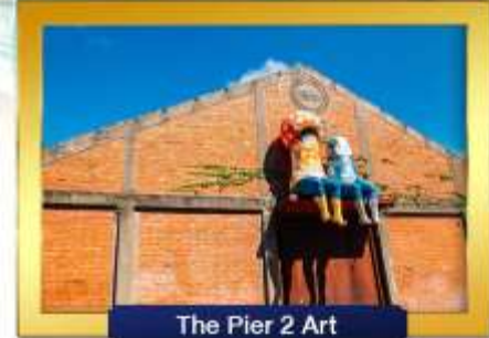
The Pier 2 Art