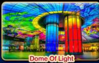
Dome Of Light