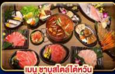
เมนูชาบูสเตอ์ไต้หวัน

ช้อปปิ้งจุใจ...ตลาดกลางคืนลือเลื่อง ตลาดรุ่งฟงโน้ก่มาร์เก็ต