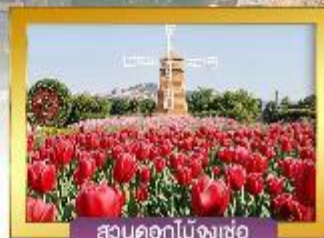
สวนดอกไม้งเซอ