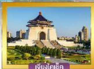
เจียงไคเช็ค