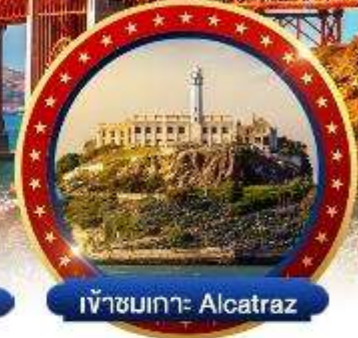
เข้าชมเกาะ Alcatraz