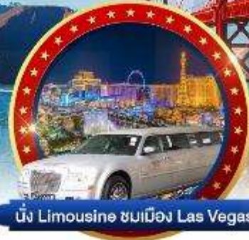
นั่ง Limousine ชมเมือง Las Vegas