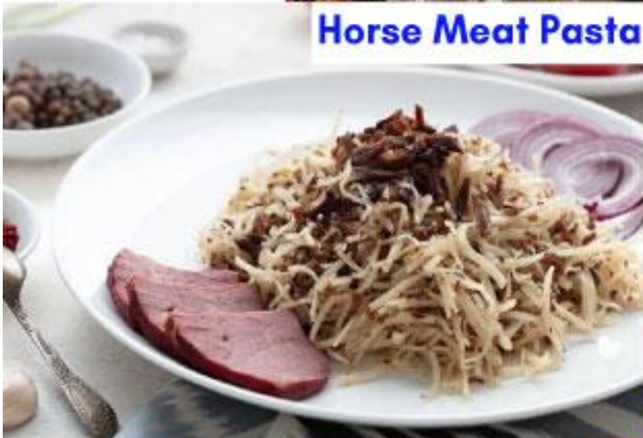
Horse Meat Pasta