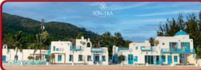
เช็คอินคาเฟ่ SON TRA MARINA