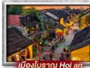
เมืองโบราณ Hoi an