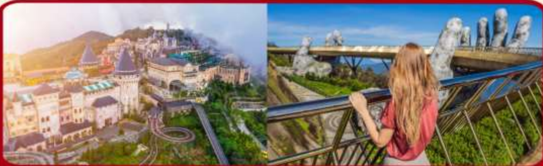
เที่ยวบานาฮิลล์เต็มวัน แบบจุใจ