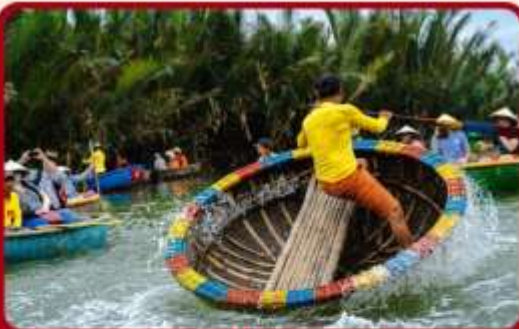
พิเศษ !!! นั่งเรือกระดัง UNSEEN เวียดนาม