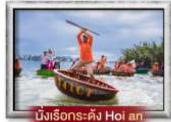
นั่งเรือกระดัง Hoi an