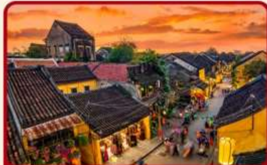
เที่ยวเมืองเก่าฮอยอัน