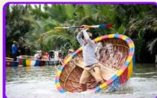
พิเศษ !!! นั่งเรือกระดัง UNSEEN เวียดนาม