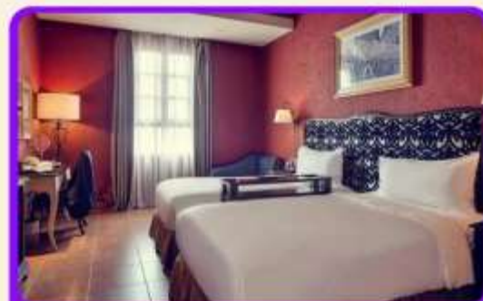
พักบนบานาฮิลล์ 1 คืน