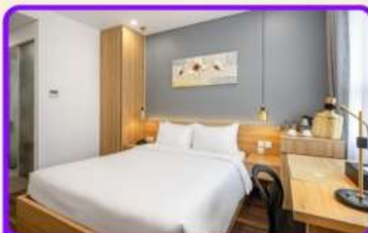
พักเมืองดานัง 4 ดาว 2 คืน