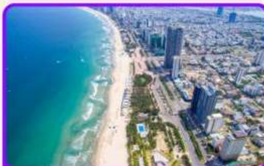
เช็คอิน ชายหาดหมีคว เป็นชายหาดที่สวยงามที่สุดในเมืองดานัง