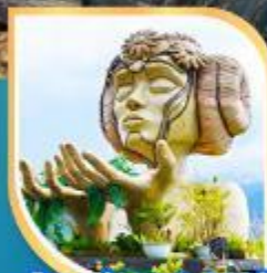
โมอาน่า ซาปา คาเฟ่