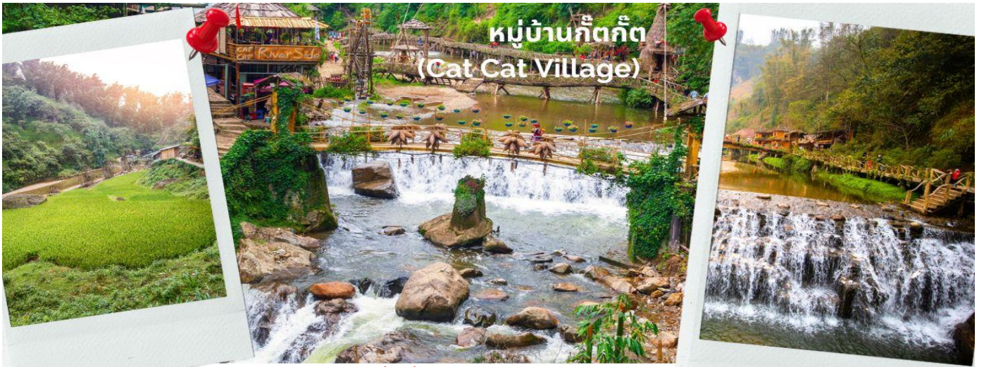
หมู่บ้านก๊ตก๊ต (Cat Cat Village)

รับประทานอาหารกลางวัน ณ ภัตตาคาร บุฟเฟต์นานาชาติ (5)