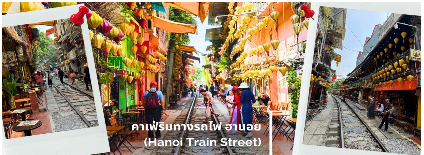
คาเฟ่ริมทางรถไฟ ฮานอย (Hanoi Train Street)