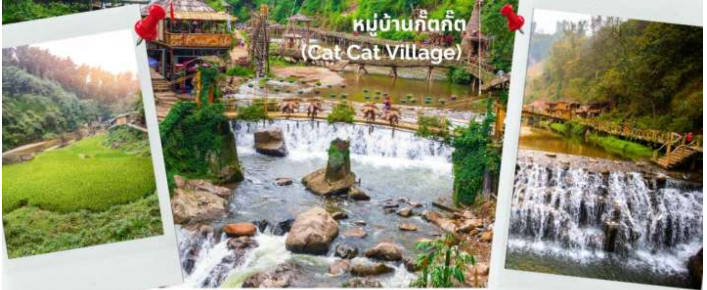
นักท่องเที่ยวที่มาเที่ยวที่นี่ได้เห็นทิวทัศน์ที่งดงามของซาปา

จากนั้นนำท่านชม หมู่บ้านก๊ตก๊ต (Cat Cat Village) หมู่บ้านก๊ตก๊ตเป็นหนึ่งในหมู่บ้านเล็กๆที่เก่าแก่ที่สุดในภูมิภาคนี้และเป็นที่รู้จักกันดีว่าเป็นหมู่บ้านของชนกลุ่มน้อยชาวม้งดำ หมู่บ้านก๊ตก๊ตเป็นสถานที่ที่เหมาะสมสำหรับทุกคนที่ต้องการประสบการณ์การเดินทาง รวมถึงสัมผัสวิถีชีวิตในพื้นที่ภูเขาด้วยและขนบธรรมเนียมประเพณีของคนท้องถิ่น หมู่บ้านก๊ตก๊ตล้อมรอบด้วยนาข้าวขั้นบันไดบนภูเขาที่สวยงาม, เนินเขาที่เขียวขจี และน้ำตกที่สวยงาม ทำให้