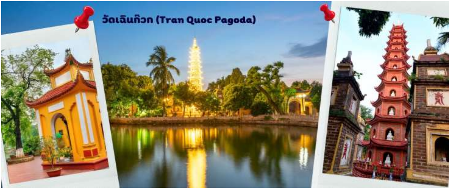
วัดเจดีย์กว (Tran Quoc Pagoda)

เส้นทางคมนาคมเข้าถึงที่ สิ่งปลูกสร้างมีการวางผังเป็นอย่างดี ใช้สีสันทกกลมกลืนในโทนสีเหลือง น้ำตาล ตัดกับสีเขียวของต้นไม้ใหญ่ที่โอบล้อมอยู่ ในมุมถ่ายภาพจากอีกฝั่งหนึ่ง จะเห็นสิ่งปลูกสร้างสไตล์จีน และเจดีย์หลายชั้นโดดเด่น มีภาพที่สะท้อนลงสู่ผิวน้ำ เป็นภูมิทัศน์ที่งดงามทั้งยามกลางวันและยามค่ำคืนที่มีการเปิดไฟส่องสว่าง