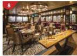
8 Bistro By Mark Best Relish contemporary Western cuisine from the internationally-acclaimed Australian chef.