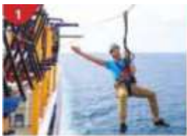
Ropes Course & Zipline Feel the thrill of gliding above the ocean on a 35-metre zipline.