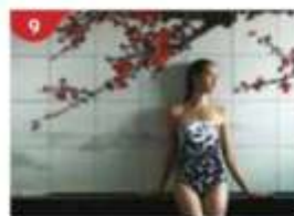
Crystal Life™ Spa Rejuvenate mind, body and soul with our holistic Western and Asian spa experience.