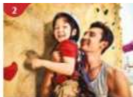
Rock Climbing Wall Challenge yourself on our mountainous rock climbing wall.