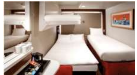
พัก 3-4 ท่าน