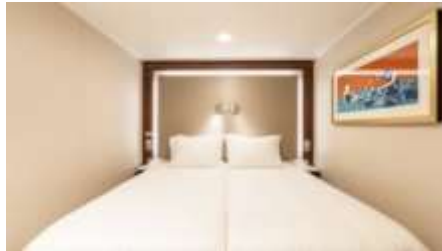
พัก 1-2 ท่าน

From 13 - 14 sq.m Max Occupancy 2-4 ^ Deck 5/8/9/10/11/12/13/15 2 Single Beds / 2 Single Beds + 1 Ceiling Pullman Bed / 1 Single Bed + 1 Pullman Bed + 1 Double Sofa Bed