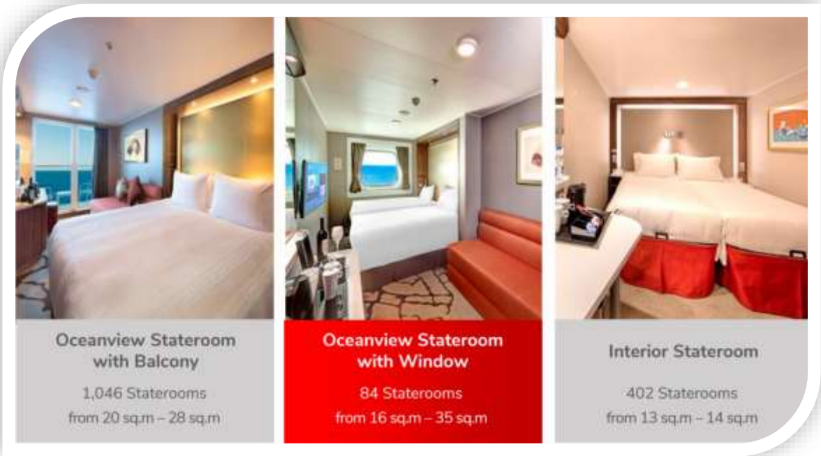
Oceanview Stateroom with Balcony 1,046 Staterooms from 20 sq.m – 28 sq.m